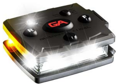
Modelo Micro Series

Cuando se activan simultáneamente la parte delantera y trasera, los LEDs se sincronizan para formar un patrón de 360 grados.