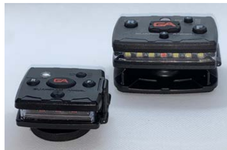
Modelos Micro y Elite

Cuenta con diferentes sistemas de montaje como: imán, casco, parabrisas, cinturón, bicicleta, camisa, brazo, conos de seguridad, arnés para perros, etc.