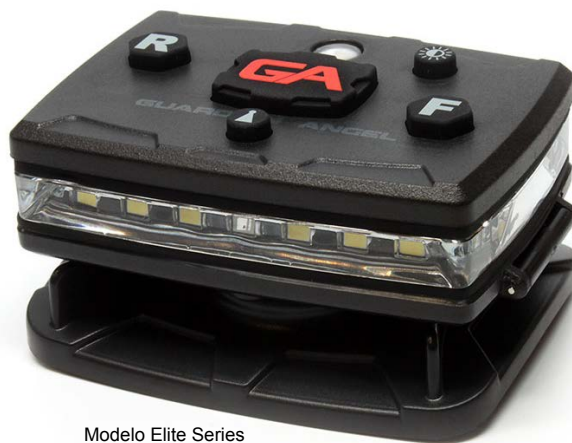
Modelo Elite Series

Trasera: presionando el botón "R" se activa la luz fija en la parte trasera, y si se presiona 2 veces, se pueden intercalar los LEDs de un modo fijo a parpadeante o secuenciado. Si se mantiene presionado el botón indica el nivel de carga de la batería.