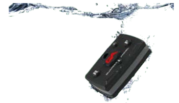
Los dispositivos Guardian Angel® tienen protección IP68